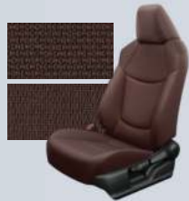
بني مائل إلى الحمرة Terra Rossa