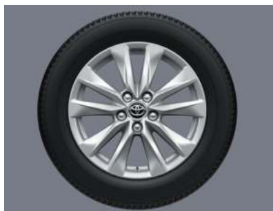
عجلات ألومنيوم مقاس 17 بوصة 17-inch Aluminum Wheel