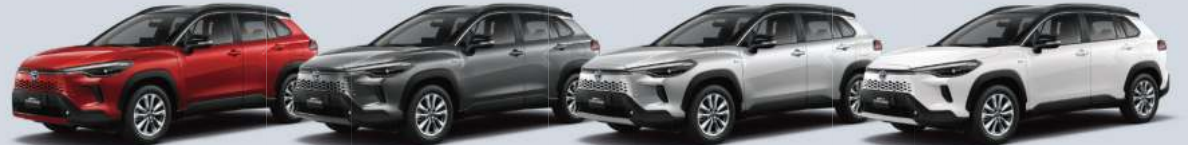
ميكاً أحمر معدني / ميكاً أسود [2NU (3R3 / 209)] Red Mica Metallic / Black Mica [2NU (3R3 / 209)] | رمادي معدني / ميكاً أسود [2MB (1G3 / 209)] Gray Metallic / Black Mica [2MB (1G3 / 209)] | فضي معدني / ميكاً أسود [2KS (1F7 / 209)] Silver Metallic / Black Mica [2KS (1F7 / 209)] | أبيض فائق 2 / ميكاً أسود [2NR (040 / 209)] Super White 2 / Black Mica [2NR (040 / 209)]