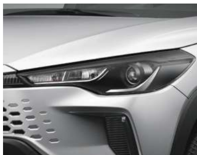
مصباح هالوجين أمامي (نوع الكشاف) Halogen Headlamp (Projector type)