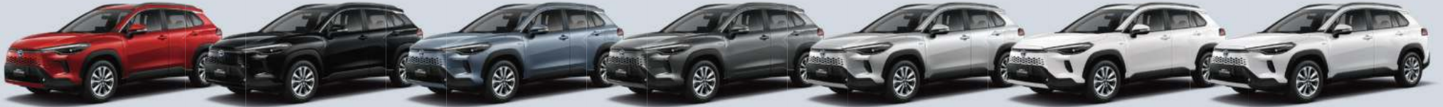
ميكاً أحمر معدني (3R3) Red Mica Metallic (3R3) | ميكاً أسود (209) Black Mica (209) | رمادي معدني سماوي (1K3) Celestite Gray Metallic (1K3) | رمادي معدني (1G3) Gray Metallic (1G3) | فضي معدني (1F7) Silver Metallic (1F7) | أبيض فائق 2 (040) Super White 2 (040) | ميكاً لؤلؤي أبيض بلاتيني (089) Platinum White Pearl Mica (089)